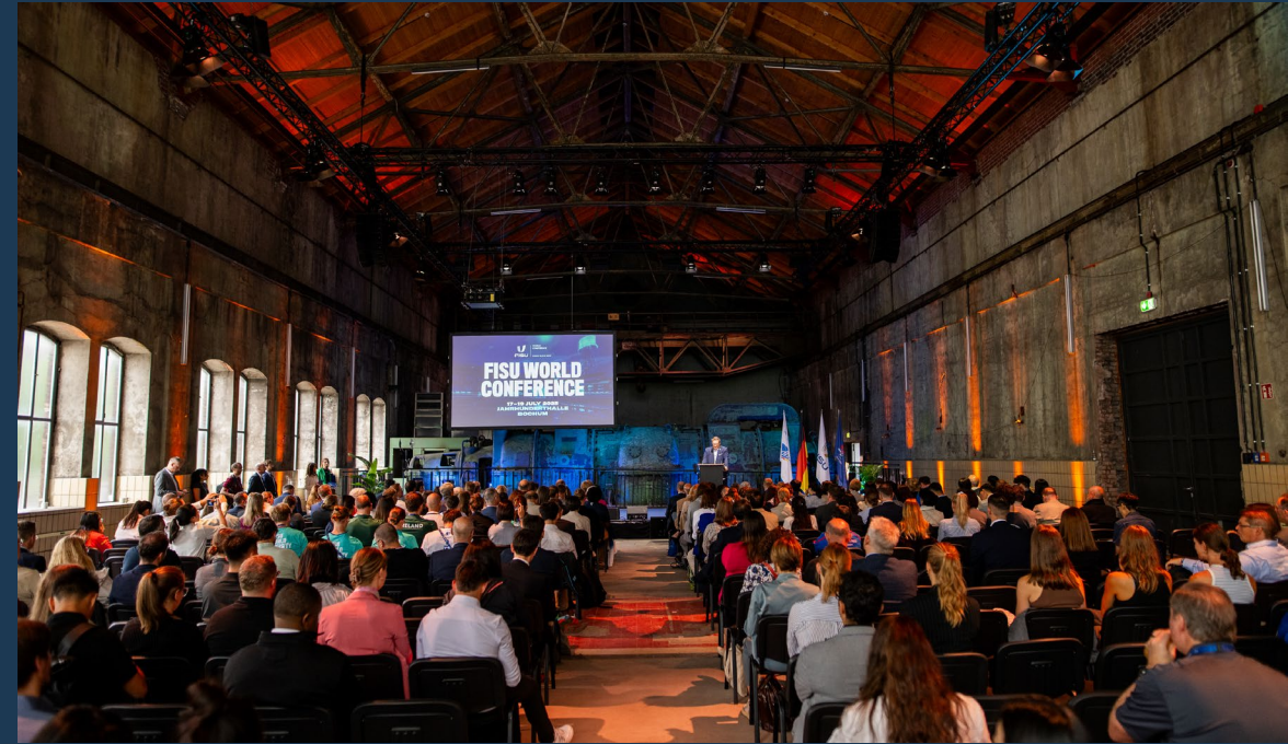
Teilnehmende der FISU World Conference